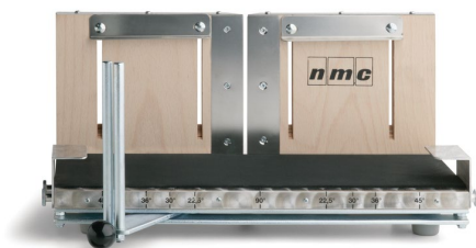
Úhlová řezačka na lišty MITRE VARIO BOX