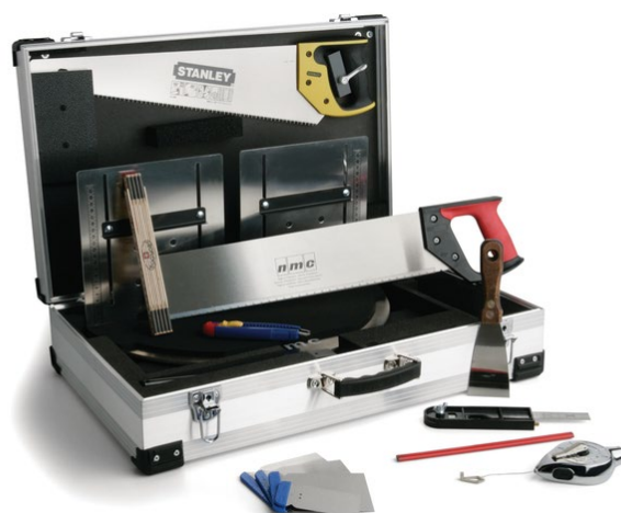
Tool VARIO BOX- kufřík